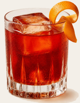
NEGRONI · 1 · 1 · 1

Florenia, hacia 1919: en el Caffè Casoni, el conde Camillo Negroni pidió que reforzaran su Americano cambiando la soda por gin, y el barman Fosco Scarselli lo remató con piel de naranja. Es la versión mejor documentada: Luca Picchi halló una carta de 1920 que ya menciona el trago.